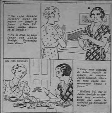
Ahora ella hace lavar su ropa con Jabón Sunlight — y economiza dinero

El Jabón Sunlight afecta maravillosamente el éxito del lavado de su ropa. Su rica espuma hace desaparecer la suciedad más adherida con la mayor facilidad, sin necesidad de frotar ni estregar. Insista Vd. en el uso de Jabón Sunlight para su ropa.