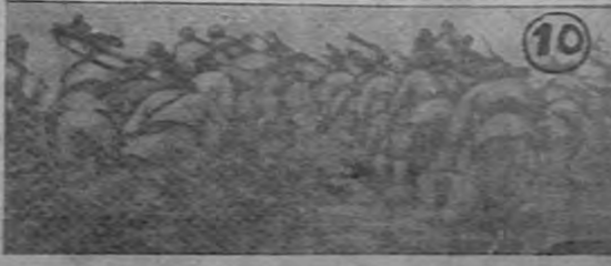
Por correo aéreo, llegaron especialmente para DIARIO DE COSTA RICA, interesantes fotografías de los más sensacionales momentos de la guerra italo-etiope. En su orden son los siguientes: 1º La escuadrilla italiana que bombardeó Adua, bajo el comando del Conde Galeazzo Ciano, y en la que iban los hijos del Duce, aparece en los precisos instantes en que entraban en acción las primeras unidades. — 2º Es una de las más sorprendentes fotografías de una multitud, que se haya visto en Europa. — 3º A través de las montañas etiopeas, una compañía con ametralladoras se dirige al frente. — 4º Uno de los pocos contingentes uniformados del emperador Haile Selassie, saliendo de Addis Abeba para detener la avanzada italiana. — 5º La silueta rara de un etiope se destaca en un puesto de observación, alerta... — 6º Un pesado cañón transportado en la zona de guerra, subiendo una montaña para situarlo en un sitio estratégico. — 7º Prisioneros de Etiopía: El Conde Maurice de Roquefeuille y su esposa, franceses, bajo arresto en Harrar. Ambos se encuentran detenidos por acusárseles de espionaje. — 8º Etiopes trabajando, pero a la vez, clavando sus miradas al cielo, ante el temor a las bombas. — 9º Fotografía del puerto de Lazzaret, en Malta, poco después de haber sido colocada una defensa, como precaución por hostilidades. — 10º Avancem!... y los nativos etiopeas, agachados, corren hacia adelante...